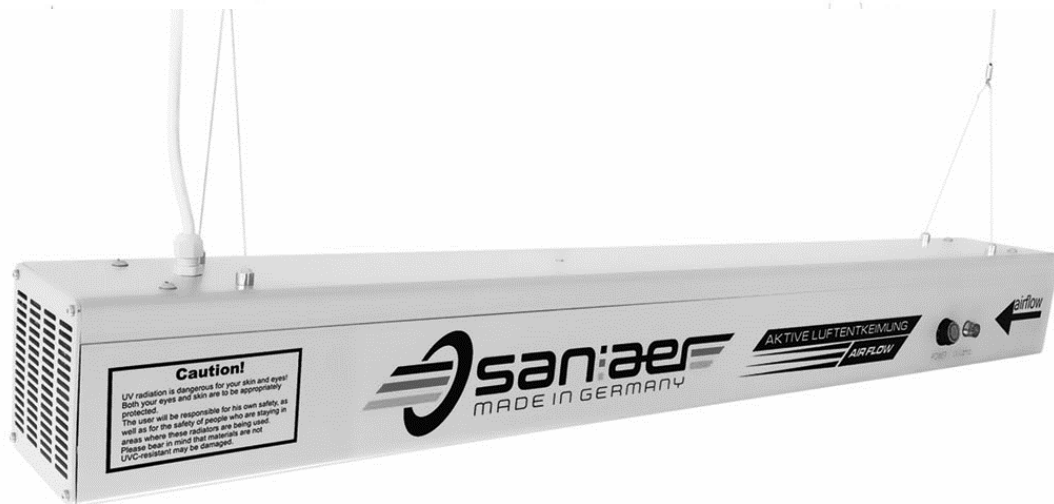
Abb.1) Lufteintrittsseite bzw. baugleich ausgeführte Luftaustrittsseite

Der Messgegenstand wurde betriebsfertig bereitgestellt. Das Gerät verfügt über einen festen Luft-Volumenstrom. Die UV-C Leistung ist nicht veränderbar.